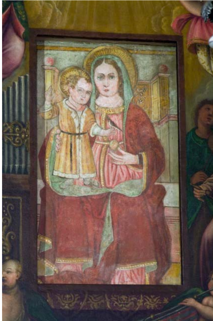
Affresco Madonna della Rondine