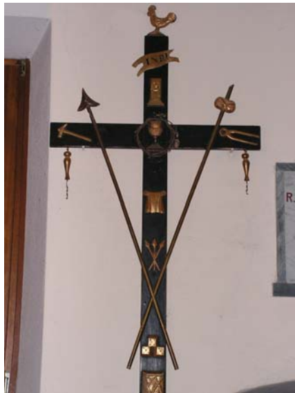
Croce della Via Crucis