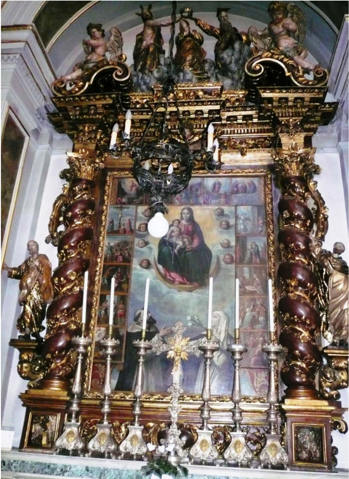
Altare Madonna del Rosario