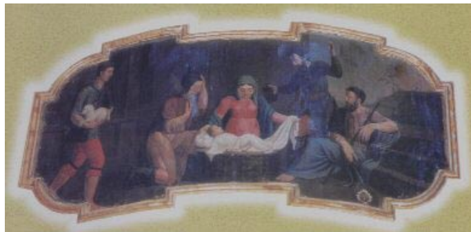
Natività - cantoria di sinistra