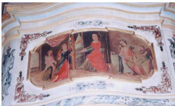
S. Cecilia – cantoria di destra (organo)