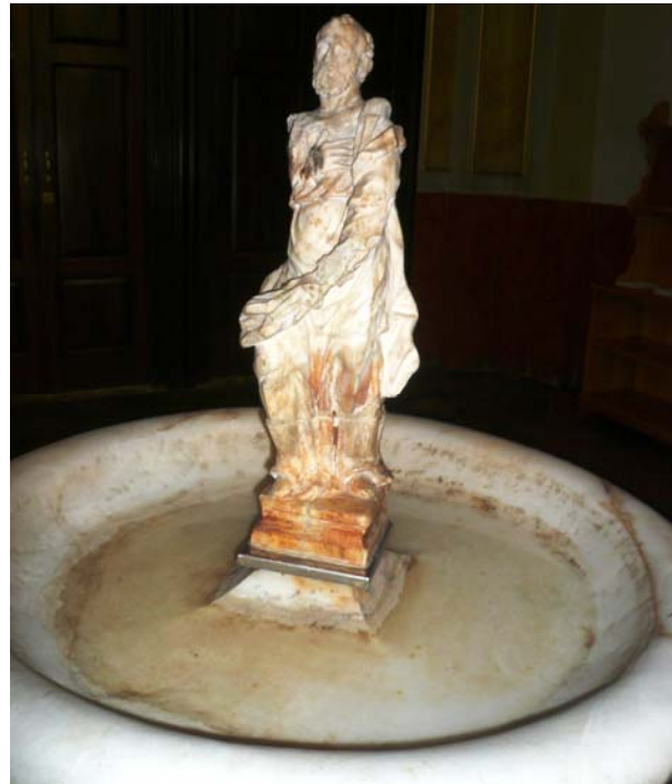
Acquasantiere San Pietro (sinistra) e San Paolo (destra)

ed il secentesco lavello nell'atrio della sacrestia (1736), di cui l' acquasantiera è in marmo policromo e il lavamano è in pietra arenaria grigia.