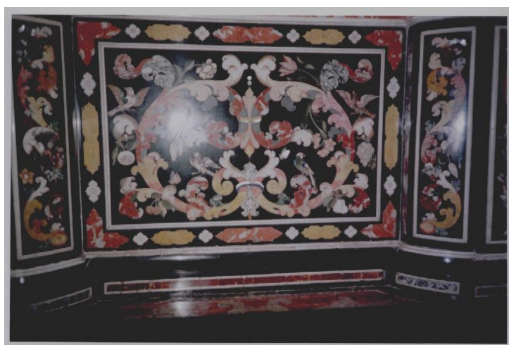
Pagliotto altare Maggiore