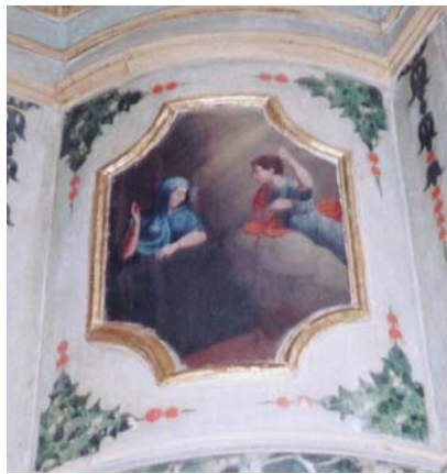
Annunciazione – cantoria sinistra

Le cantorie, che sono settecentesche, erano state arbitrariamente dipinte nel 1940: sono state recuperate nei restauri del 1987 e hanno suscitato l'ammirazione e la curiosità di tutti.