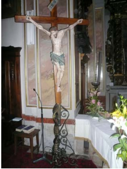
Antico Crocifisso del '700