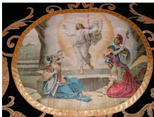
Medaglione tappeto - Resurrezione

Il sagrato risale al 1741 quando viene delimitata l'area attorno alla Chiesa con la realizzazione di un selciato eseguito da Battista Bardella. Nel 1877 vengono collocate le 33 colonnette, in pietra Simona, che delimitano il sagrato. Il sagrato ha subito nel passato diverse trasformazioni, sia nella pavimentazione, che nella recinzione. Con gli ultimi restauri (2000) si è voluto riportarlo il più possibile al suo stato originario. I cubetti di pavé sono stati sostituiti con ciottoli di selciato e le colonnette ristrutturare sono state collegate tra loro da tiranti rigidi, che hanno sostituito le catene. Il selciato di color grigio ora è perfettamente in sintonia con le colonne in pietra di Sarnico dei due capitelli e la nuova zoccolatura.