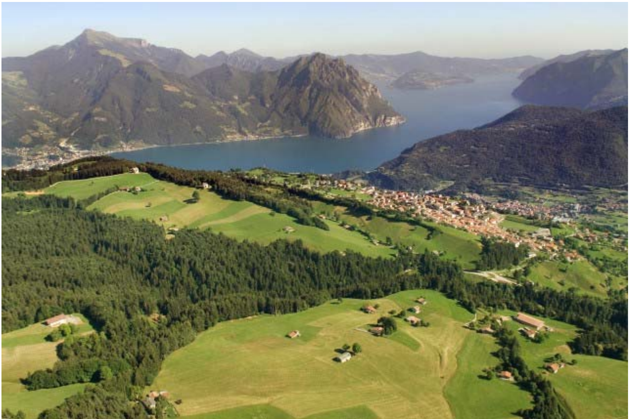
VEDUTA DALL'ALTO DELL'ALTOPIANO DI BOSSICO

Thanks to its privileged position, Bossico enjoy itself of a mild climate due to the closeness of the lake and the exposure to the sun from dawn to sunset.