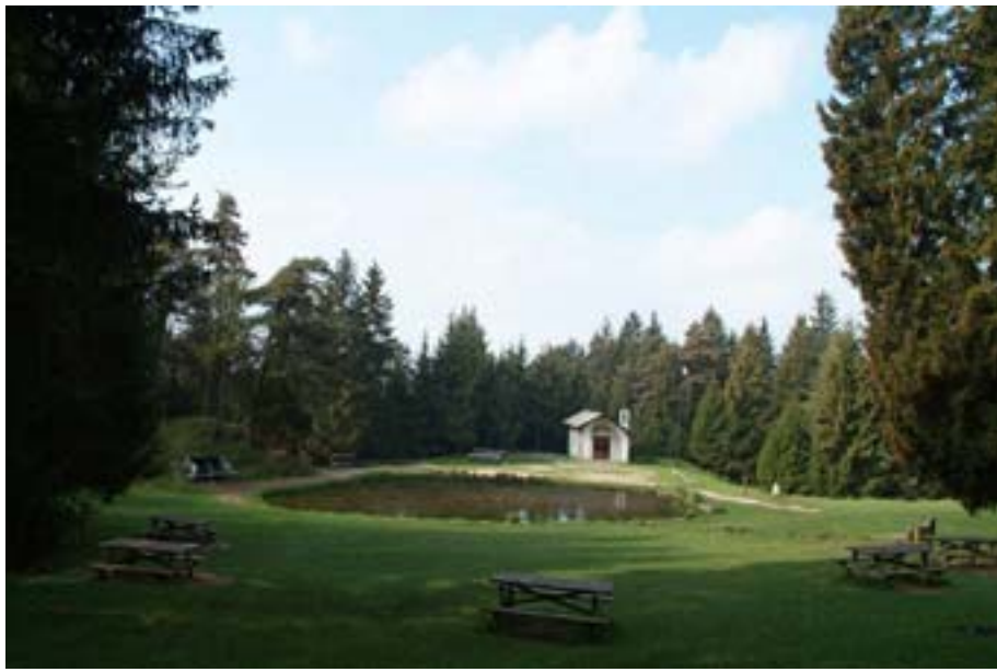
AREA PIC-NIC PICNIC AREA