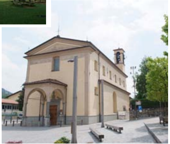
CHIESA S.S. PIETRO E PAOLO SS PETER AND PAUL CHURCH