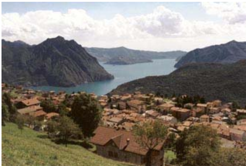
IL PAESE THE COUNTRY